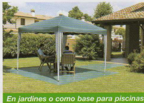
En jardines o como base para piscinas