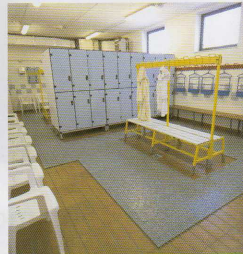
En vestuarios y centros deportivos

Multiplate es un producto altamente modular y flexible producido con plástico reciclado. Es la solución ideal para crear islas o caminos sobre diferentes superficies como hierba, arena, tierra batida y cemento, según las exigencias del cliente. De aplicación práctica y muy ligero, se puede utilizar más de una vez.