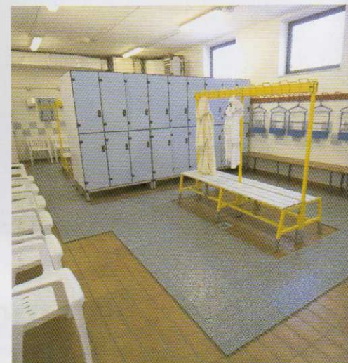
En vestuarios y centros deportivos

Multiplate es un producto altamente modular y flexible producido con plástico reciclado. Es la solución ideal para crear islas o caminos sobre diferentes superficies como hierba, arena, tierra batida y cemento, según las exigencias del cliente. De aplicación práctica y muy ligero, se puede utilizar más de una vez.