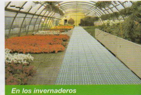
En los invernaderos