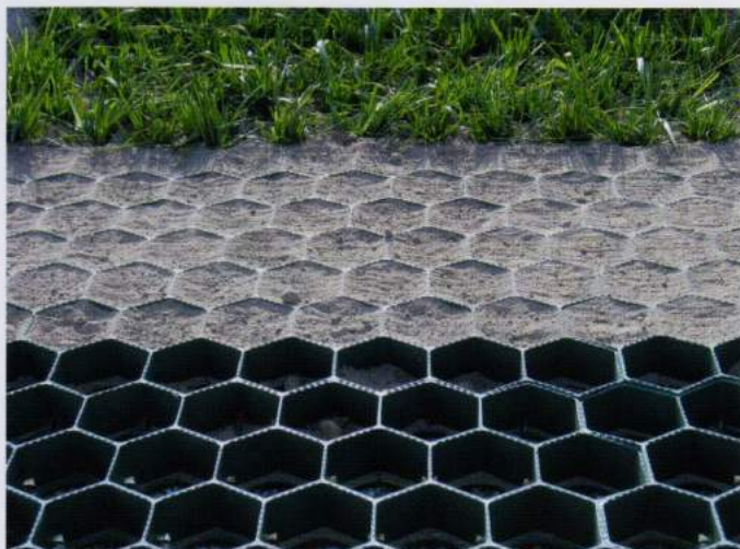
CELDAS MÁS GRANDES